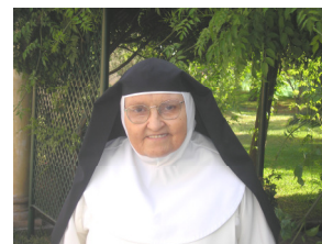
Sor Purísima 85 años de edad 51 años de VR

♣ ¿Puedes compartir tu experiencia vivida de la Regla en este V Centenario?